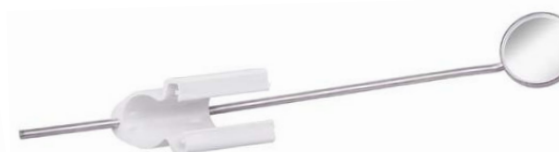
Kombihalter mit Kehlkopfspiegel Combination holder with laryngeal mirror