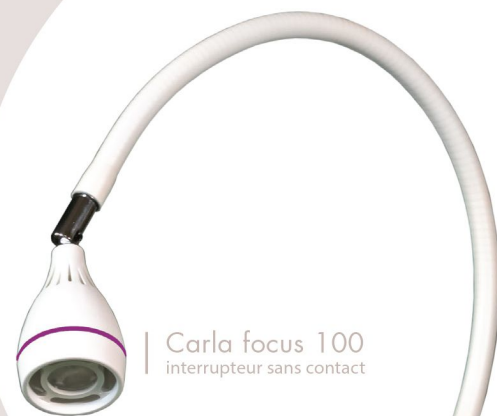
Carla focus 100 interrupteur sans contact