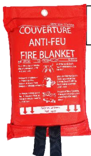
COU 7052 AF 120 x 180 cm