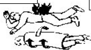
Feux de vêtements