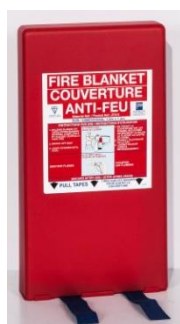
COU 7054 AF 120 x 180 cm