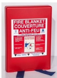
COU 7053 AF 120 x 120 cm