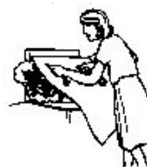
Feux de friteuses