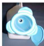
Retirer l'adaptateur féminin. Tourner la bague pour retirer l'embout facilement