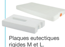
Plaques eutectiques rigides M et L.